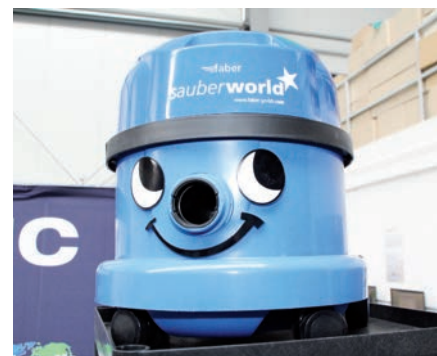
Der Sauberworld-Sauger auf der Hausmesse von Numatic

Numatic International GmbH, Hannover Tel.: 05 11/98 42 16-0