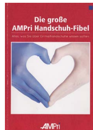
Die Handschuhfibel für den Anwender

AMPri Handelsgesellschaft mbH, Stelle Tel.: 0 41 74/71 87-0