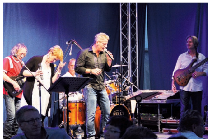
Musikalisch gefeiert wurde mit einer Live-Band.