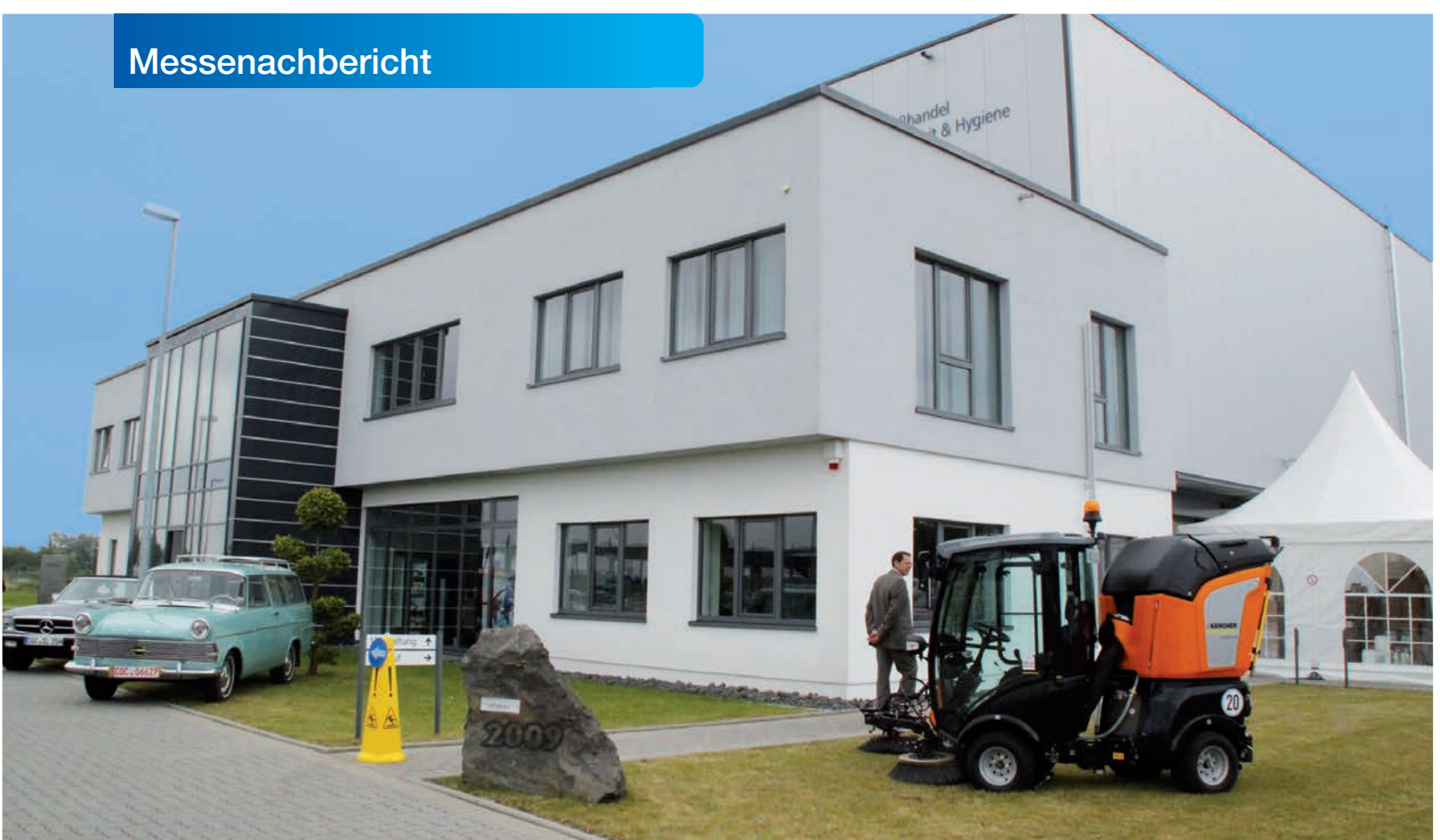
Blick auf die modernen Gebäude der Firma Faber.