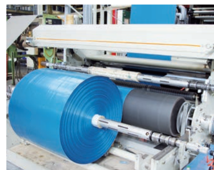
Ein Blick in die Produktion von Pakufol

Pakufol Folienprodukte GmbH, Siegelsbach Tel.: 0 72 64/890 20-0